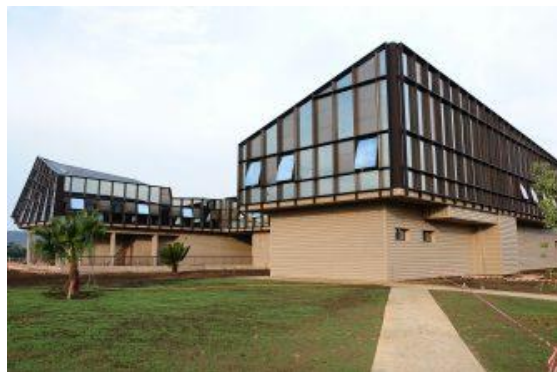
Ecole des Mines et de Métallurgie de Moanda, Gabon